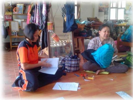
3. นำลวดลายที่ได้มาเย็บติดกันจนเป็นแบบบล็อกหมอน