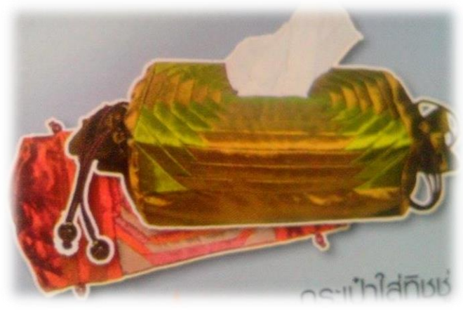
กระเป๋าใส่ทิชชู