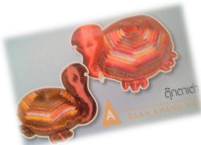
ตุ๊กตาเต่า