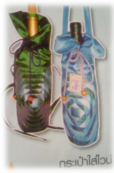
กระเป๋าใส่ขวด