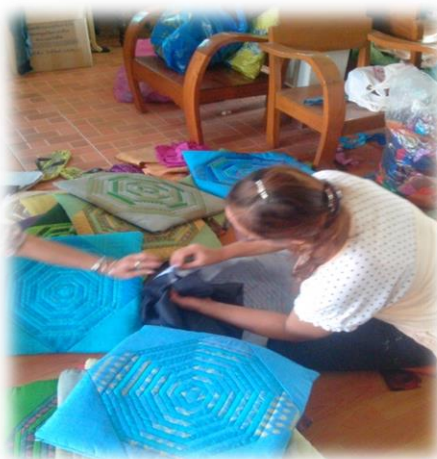
5. เมื่อเย็บบล็อกหมอนติดกับผ้าโพรีได้ 3 ด้านแล้ว ให้นำตัวซิปมาเย็บติดใน ด้านที่ 4 เมื่อเย็บครบ 4 ด้านจะได้บล็อกหมอนที่เสร็จแล้ว ขนาด 16 x16