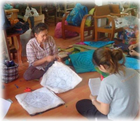
4. นำแบบบล็อกหมอนมาเย็บติดกับผ้าโพรี