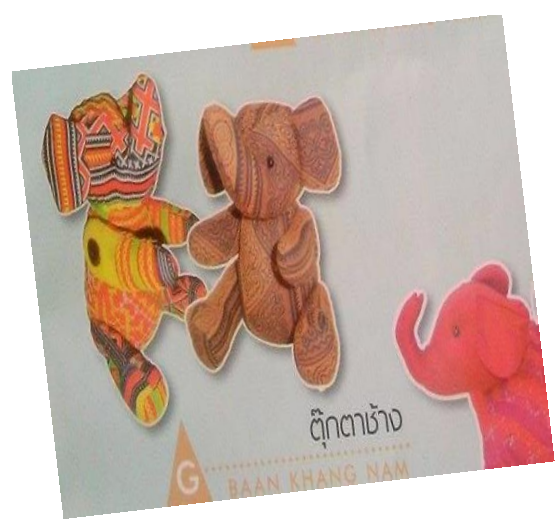
ตุ๊กตาช้าง